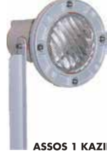
ASSOS 1 KAZIKLI