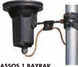
ASSOS 1 BAYRAK