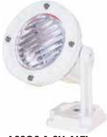
ASSOS 1 SU ALTI